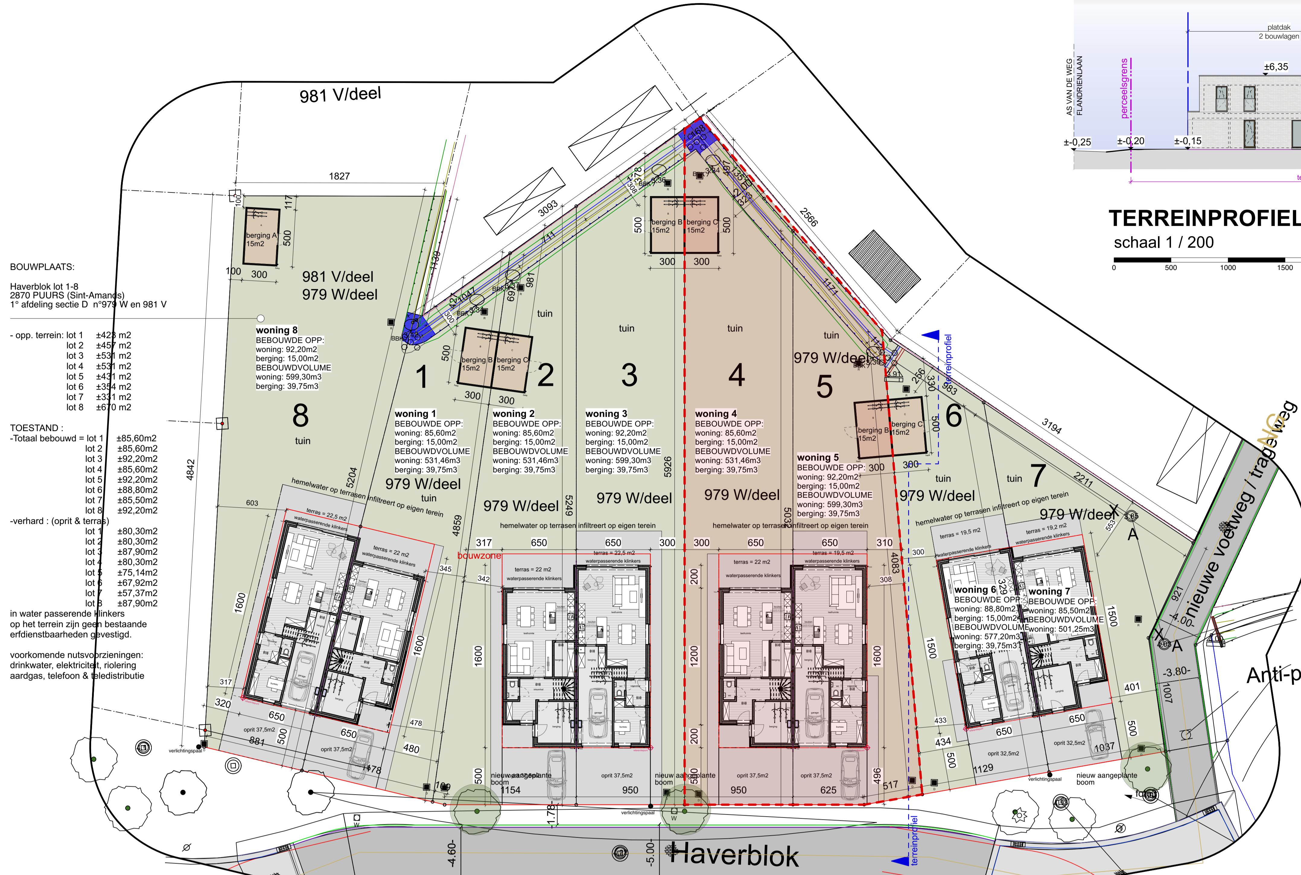
INPLANTINGSPLAN NIEUWE TOESTAND schaal 1 / 200